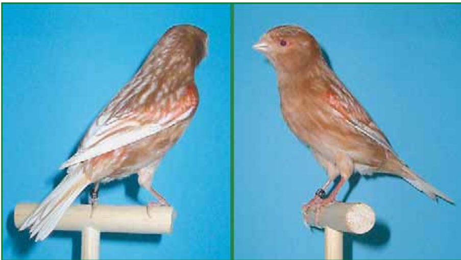
Foto 2: Phaeohenne rot mosaik (Typ 1) / Züchter: Rainer Bindschädel.