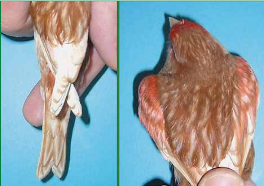
Foto 4: Phaeohahn der Schwarzreihe in rot mosaik (Typ 2) / Züchter: Rainer Bindschädel.