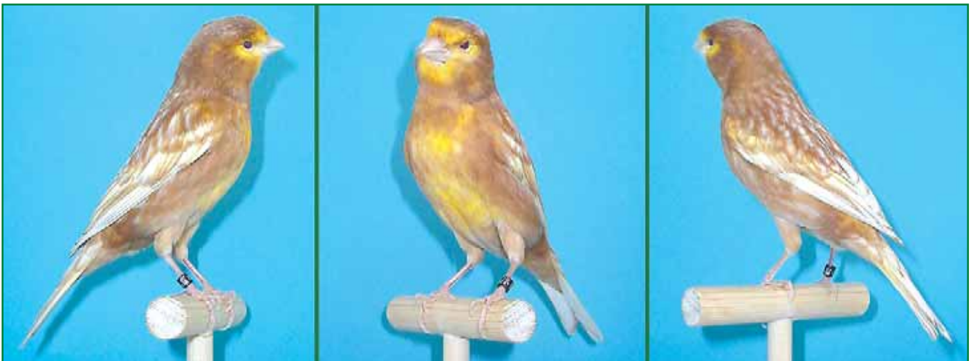
Foto 3: Phaeohahn gelb mosaik (Typ 2) / Züchter: Alexander Hintermayer.