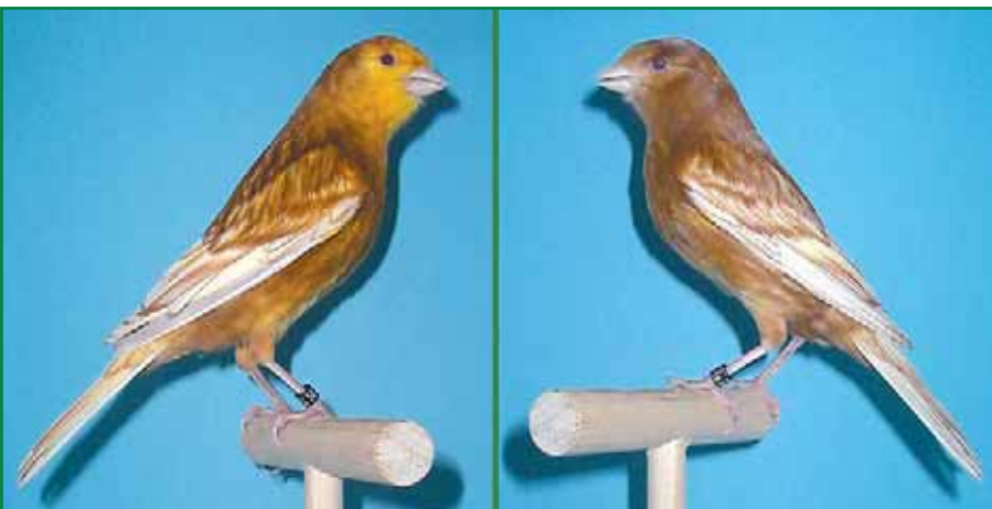
Foto 7: links: Phaeohahn gelb intensiv, rechts: Phaeohenne gelb intensiv / Züchter: Rainer Bindschädel.