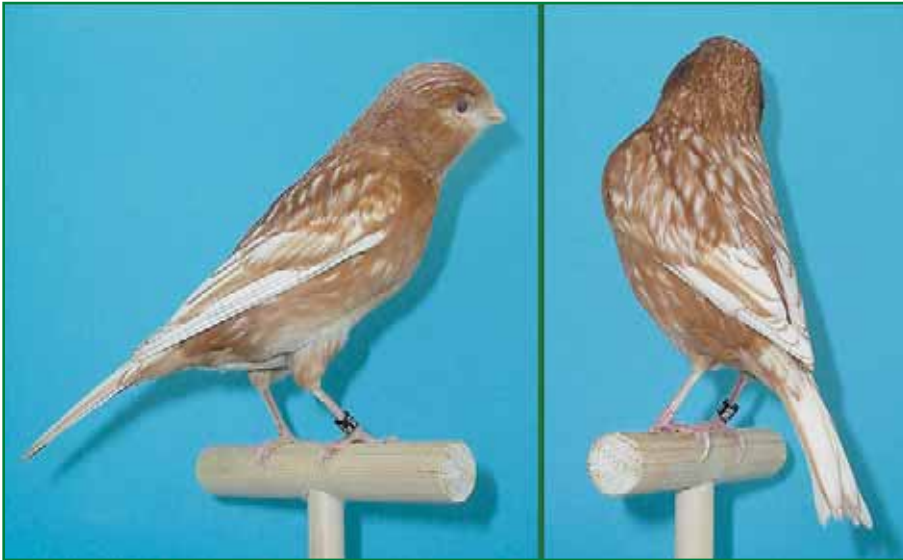
Foto 8: Phaeohenne gelb ivory mosaik (Typ 1) / Züchter: Alexander Hintermayer.